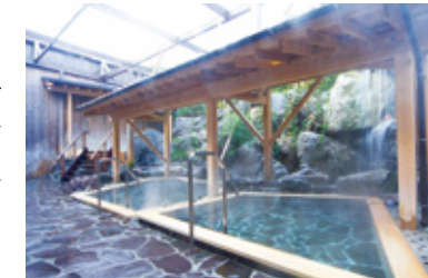
全天候型の露天風呂

医療機関に併設した温浴施設で、“安心・安全・清潔”の空間で、上質な天然温泉の湯浴みをお楽しみ頂けます。温泉利用型健康増進施設としての入浴設備、五木村の自然石と樹木を利用した露天風呂、バリアフリーの家族風呂「いつでも一番風呂」が特徴です。併設した食事処では管理栄養士の監修した健康メニューも提供し、地元の交流会やサロンとしてもご利用いただいています。地域に密着した施設として、“食と体づくり”に関わる情報に加えて、介護予防や認知症予防など“地域づくり”に関する情報も積極的に発信しています。