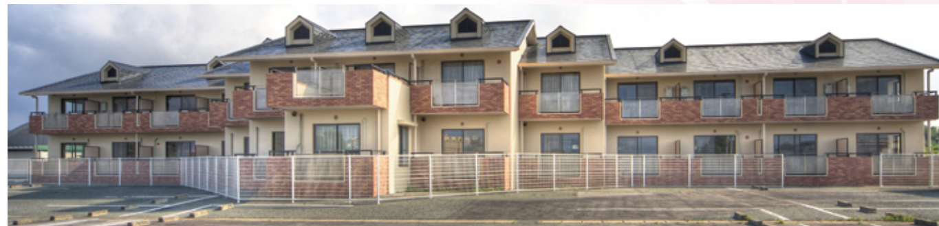
ケアリゾート弥生外観

コミュニティハウス水野／熊本県荒尾市水野131番地-1 コミュニティハウス弥生／熊本県荒尾市本井出1480番地-20 ケアリゾート弥生／熊本県荒尾市本井出1480番地-15