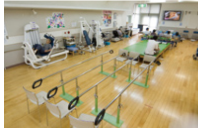
広々としたりリハビリテーションフロア

平成ドリーム館は「お年寄りに夢と光を」を活動理念に掲げ、地域に根ざした多機能の“在宅総合ケアセンター”を目指して、在宅生活の支援とリハビリテーションに特に力を入れています。