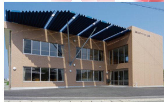
コミュニティハウス水野外観

入居者の方々には医療や介護のサービスに加えて、天然温泉での入浴、こだわりの食事、リハビリや機能訓練などのサービスも提供しており、ご自由にご利用いただいております。施設内には介護士(2級ヘルパー)、介護福祉士が常在し、また定期的に医師、看護師、薬剤師、管理栄養士、理学療法士、健康運動指導士、社会福祉士が訪問して、生活の安心・安全を支えるサポートを心がけています。