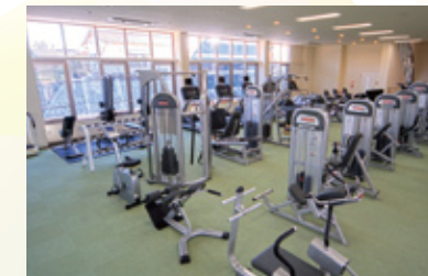
22種40機を揃える充実のフィットネス

健康増進施設スーパードリームは、定められた各種基準を満たし、“健康増進のための温泉利用および運動を安全かつ適切に実施できる施設”として厚生労働大臣より認定を受けています。施設内には研修を受けた健康運動指導士、介護予防運動指導員、温泉利用指導者が常在しており、適切な生活指導を提供しています。