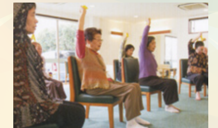
自然体で楽しくリハビリ

nagomi荒尾店では、介護予防を目的にリハビリに特化したサービスを提供しています。少人数グループ形式で、東京のFC本部で開発された運動生理学に基づくオリジナルプログラムを実施しています。疾患や身体状況に応じて運動方法や指導方法を変え、“無理なく楽しく継続できる”運動を通してこころとからだの健康維持・改善を目指しています。