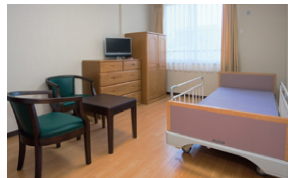
ゆったりとした居室空間(コミュニティハウス水野)