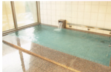
バリアフリーの共同浴室

少人数の中で個々の生活様式を尊重し、豊かな人間関係を保ちながら、入所者それぞれの能力を最大限に活用できるような住居環境の提供を心がけています。また、家族や地域住民の方々との交流の場を積極的に設けており、さまざまなケアの相談にも対応しています。