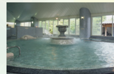
広々としたくつろぎの大浴場

主浴、運動浴、寝湯、あつ湯など、室内には趣向に富んだ全12種類の浴槽を備えており、また露天風呂や約40人が同時に入れる特大のセラミック式遠赤外線サウナ室も好評です。食事処や地域の農産物・名産品の直売所も併設しており、荒尾市の観光スポットのひとつになっています。