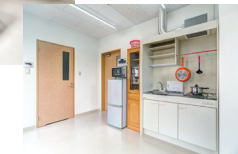
日常生活動作(ADL)訓練室